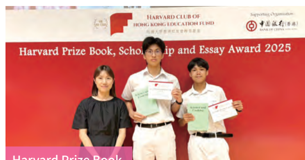
Harvard Prize Book

Teachers will incorporate real-life topics across subjects to make English learning more meaningful and relevant to students' daily lives. Tutorial classes will be provided for students who need extra help, while high-achieving students will be encouraged to participate in external competitions to further challenge and extend their abilities.