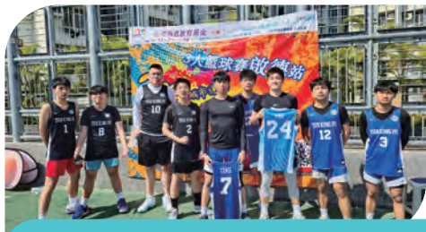
正向城市運動節 杜葉錫恩教育基金 三人籃球賽 - 啟德站 2025 男子 U16 季軍 女子 U16 亞軍