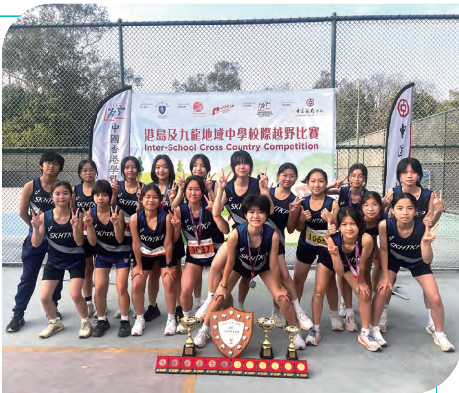
中學校際越野比賽 第三組 (四區) 女子組 女子丙組團體冠軍 女子甲組團體季軍 女子團體總亞軍