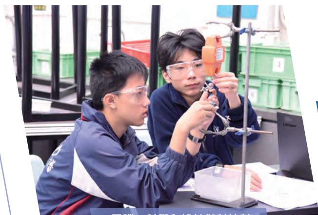
電腦、科學和設計與科技科 AI 設計與環保袋實測