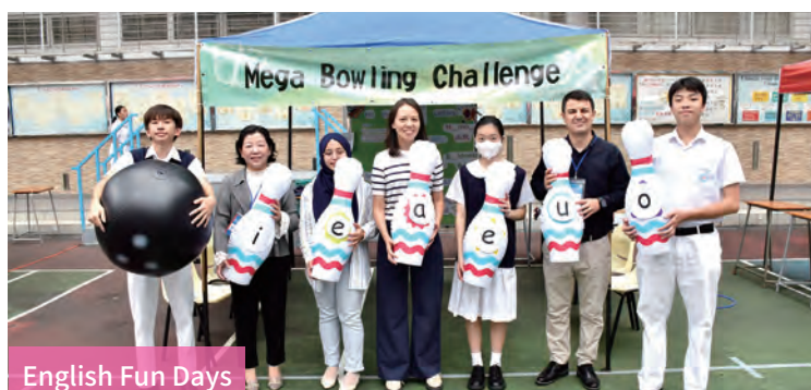
English Fun Days

To enhance the English learning experience, our school organizes a wide range of annual activities, including English Week, themed lunchtime learning sessions, English Speaking Days, Drama classes and appreciation sessions, Book-sharing assemblies, English Fun Days, Guest speaker sessions, English drama competitions and English musical performances.