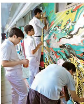
學生共同繪製學校藝術廊壁畫