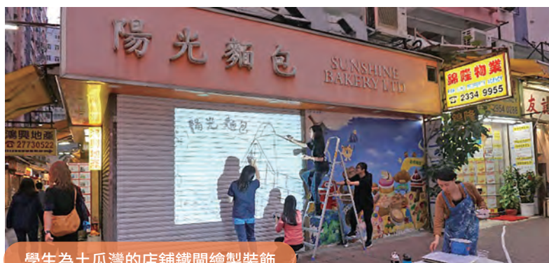
學生為土瓜灣的店鋪鐵閘繪製裝飾