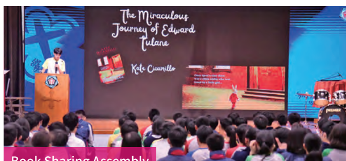
Book Sharing Assembly

By cultivating a vibrant, English-immersive environment and offering meaningful learning experiences, we empower students to express themselves confidently in English. Our approach blends structured language development with interactive, real-world learning—ensuring every student has the opportunity to succeed on their English language journey.