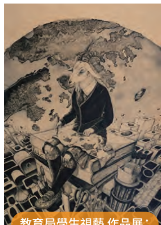
教育局學生視藝 作品展： 金獎 許佳欣「迷途者」