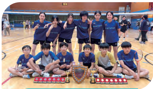
香港學界體育聯會九龍地域 中學校際羽毛球賽 (第三組) 男子丙組 冠軍 女子丙組 季軍